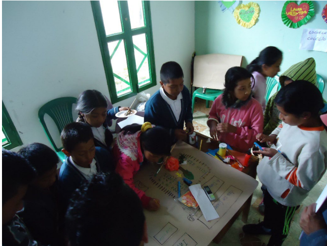
Figura 3. Dibujo realizado por los niños y niñas del resguardo de Mosoco.

De esta manera es necesario resaltar las estrategias puestas en marcha para el fortalecimiento de las prácticas de identidad nasa que familias e instituciones han venido impartiendo en los últimos años, siendo un tema en las agendas políticas de comuneros y líderes preocupados por salvaguardar los pensamientos y sabiduría ancestral enfrentados a sistemas modernistas.