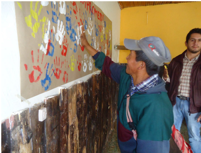
Figura 2. Autoridades de los resguardos indígenas, haciendo parte del pacto inicial de la formulación de la PPIA.

La PPIA fue realizada en 9 zonas del municipio con actores sociales, autoridades y representantes de las instituciones. El ejercicio llevado a cabo, por la administración municipal de la época, fue aprobado en el 2015 para un período de 12 años. Esta expresa las situaciones deseadas por las semillas de vida evidenciando la experiencia dada desde las comunidades indígenas, afrodescendientes, campesinas y mestizas con las que se comienza con un pacto inicial, de donde se da a conocer sueños a futuro, partiendo de las realidades en las que se encuentran los habitantes, reconociendo la diversidad étnica que prevalece en el territorio; lo cual permite un enfoque diferencial en la formulación de la política, reconociendo la importancia de los tejidos culturales y estrategias políticas que se vienen poniendo en práctica para mejorar la calidad de vida de todo un municipio especialmente de las futuras generaciones.