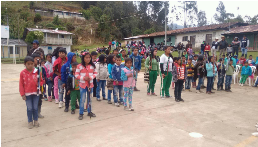
Figura 4. Posesión del cabildo escolar de la institución educativa Juan Tama, 2015.

Por tanto, los adultos (o los padres, abuelos y autoridad tradicional) plantean la importancia de potenciar la identidad étnica nasa a través de una enseñanza que promueva espacios de formación; que impliquen el fortalecimiento cultural, pensamiento ancestral y conservación de prácticas cotidianas en las que se incluye el acompañamiento de las familias e instituciones educativas y comunitarias dentro del fomento de la medicina tradicional, uso del nasa yuwe, consumo de alimentos sanos y limpios, elaboración de artesanías, fortalecimiento del cabildo escolar y participación de los niños en espacios comunitarios de labranza, mingas y otros.