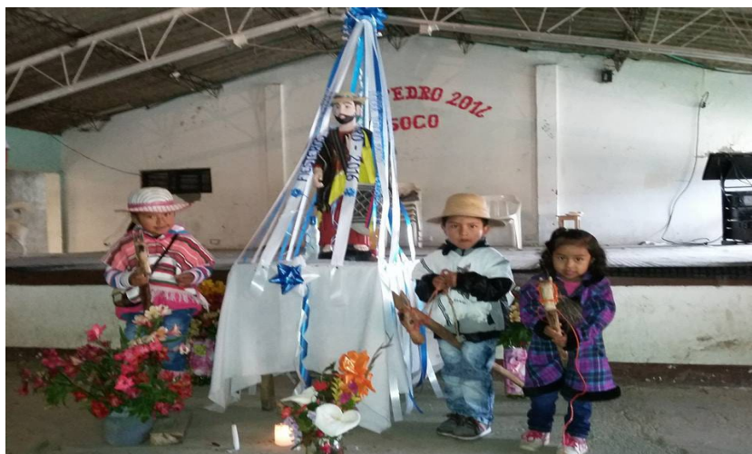
Figura 5. San Pedro y San Juan en el resguardo indígena de Mosoco, 2015.