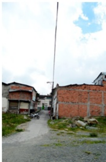
Fotografía 6. En el barrio Colón en la calle 24 carrera 11a, Comuna San José. Fecha: mayo de 2013.

Las fotografías son siempre la representación de un pasado, son el testimonio de una historicidad cambiante del mundo social que queda enmarcada brevemente en la traducción química o digital que hace el medio audiovisual de la luz y de los espacios a través de las películas o los sensores que captan y componen la imagen en la fotografía. Cuando este proceso ocurre, el mundo ha continuado su curso y el flujo de la vida indifectiblemente persiste, dejando a la imagen fotográfica en un tiempo pasado y en la noción del hecho ocurrido, tanto para el fotógrafo como para el público que la observe.