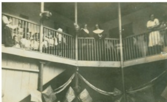
Fotografía 11. En el Parque San José, antes Parque Rafael Uribe Uribe, calle 27 carrera 16, en el interior del Colegio La Divina Providencia. Año: 1960.

Fue desde ese momento que según ella, comienza el interés de su padre por la fotografía. Un gusto que se profundizó más cuando vio sus propias imágenes en el papel fotográfico, luego de que las llevara a revelar en los estudios del fotógrafo profesional que más se destaca de la Comuna. El fotógrafo Rivera tenía un estudio de fotografía, donde revelaba fotografías y atendía a sus clientes cuando buscaban un estudio para los retratos, y a los cuales representó de manera honorable cuando retratarse era una verdadera ceremonia que implicaba el vestido especial, adecuarse a una pose respetable en un escenario preparado, permanecer inmóvil un tiempo, y luego el fognazo, el retoque y tal vez la necesidad de tener que repetir la toma de la fotografía.