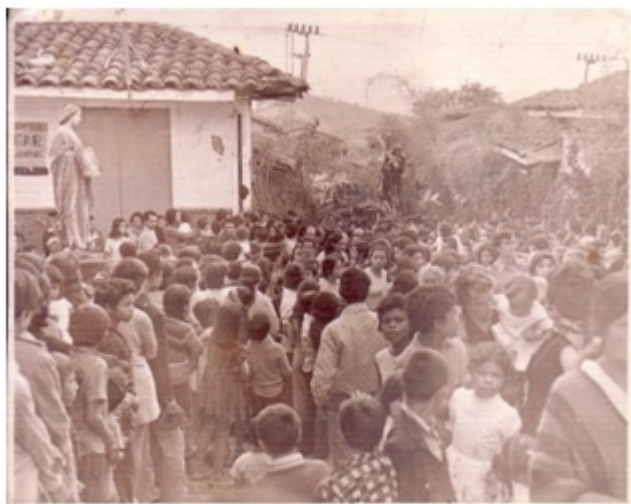
Fotografía 8. Procesión de Semana Santa (década de 1950, aproximadamente). Desde hace más de 20 años que la procesión no pasa por esta ruta, que iba desde El Tachuelo hasta el Parque San José, y atravesaba todo el barrio La Avanzada. La solemnidad del rito y su altísima concurrencia de personas (al menos durante la época en la que fue tomada la fotografía) hacen de esta fotografía algo único, y sorprende que su propietaria la tenga por azar, ya que la ha cuidado durante más de 50 años.

El barrio La Avanzada por su parte, es uno de los espacios más significativos del sector, ya que por su geografía semi-llana ha sido un territorio estratégico en el poblamiento inicial de la ciudad, de allí su nombre. En los relatos orales se conservan algunas reseñas de cómo este camino permitió a la avanzada antioqueña acercarse e integrarse a través de la Comuna San José al Centro de la ciudad, pareciendo ser entre las cimas, una pequeña recompensa a los largos y aguerridos caminos recorridos que a mula o en jeep (devenidos en los yipaos de hoy) realizaran después sus descendientes.