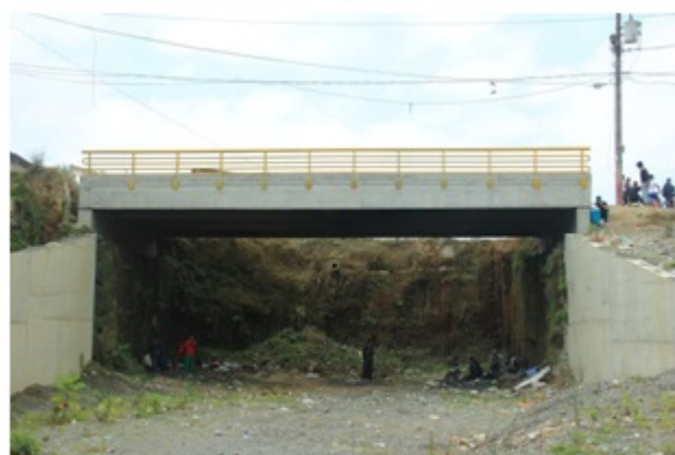
Fotografía 4. Barrio La Avanzada en la calle 27 en la entrada del Camino del Medio, Comuna San José. Fecha: mayo de 2013.