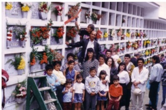
Fotografía 16. Fotografía del Día de la Madre (mediados de la década de 1990). Si bien el cementerio San Esteban no hace parte de la Comuna, esta fotografía evidencia al menos dos aspectos clave de la socialización de sus habitantes, y es la conexión con sus muertos, sus ancestros y sus seres queridos perdidos (y de paso se ratifica la ubicación estratégica de habitar en esta zona de la ciudad). El otro aspecto que evidencia es el uso que hacían los padres del espacio público (como organización de eventos vecinales y lucha por dotación urbana), ya que en esta foto se encuentran personas que no son familiares directos, sino vecinos.

Con respecto a la vida en el barrio, las ganas de departir y las fiestas populares en las calles de la Comuna han desaparecido, específicamente porque sus habitantes han migrado hacia otros barrios, como San Sebastián, Sinaí, El Carmen, entre otros. El proyecto económico de renovación urbana, ha difuminado también los deseos de establecer redes entre los vecinos. Hay una especie de desintegración de las relaciones, de los vínculos y de los afectos entre familiares y entre vecinos. A esto se le suma la supresión de un conjunto de prácticas populares por ir en contra de las disposiciones de salubridad y seguridad públicas, como el manejo de la pólvora y la carnicería a cielo abierto.