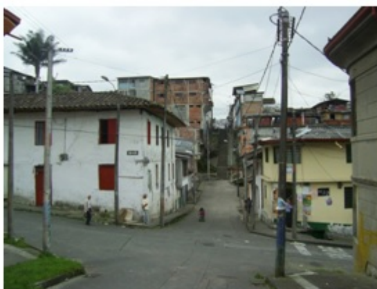
Fotografía 1. Barrio La Avanzada en la calle 28, Comuna San José. Fecha: abril de 2011.

Es a partir de estos paralelos que se evidencian las transformaciones urbanísticas que implican cambios en los modos de habitar y representar ese espacio urbano de la Comuna San José, generando nostalgias, angustias y preguntas en aquellos que han configurado durante décadas redes sociales y memoria colectiva en la ciudad, y que además, la han visto desvanecerse en el aire en unos pocos meses.