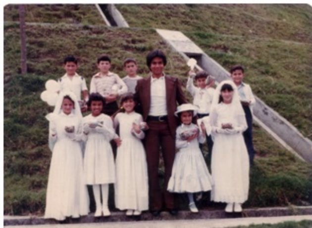
Fotografía 10. Primera Comunión en el barrio Estrada (principios de la década de 1980). El uso de los espacios públicos para conmemorar y solemnizar un evento religioso se ve consolidado y conservado en esta representación fotográfica.

Este acercamiento a los álbumes fotográficos, sirve como punto de contraste para reconocer la importancia de los espacios públicos en la configuración de las redes sociales, redes que han sido aisladas progresivamente por el plan de renovación urbana que continuamente está desplazando a los habitantes de la Comuna a otras áreas urbanas y rurales de la ciudad, encauzando la memoria colectiva del sector hacia el olvido intencional.