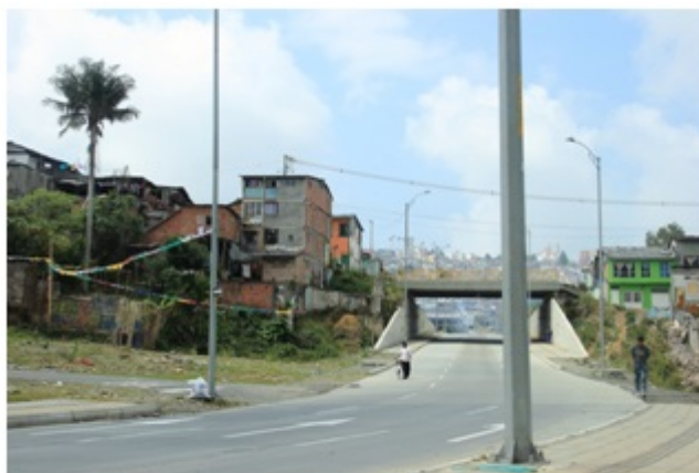
Fotografía 2. Barrio La Avanzada en la calle 28, Comuna San José. Fecha: marzo de 2013.