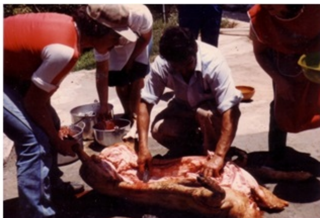
Fotografía 17. Sacrificio de marrano comunitario (década de 1980). De un modo más profano que en los ejemplos anteriores (en donde veíamos a personas solemnes con poses planificadas), en esta escena vemos sí la ritualidad mas no solemnidad en la que insiste Bourdieu cuando habla de la clase burguesa en Francia. La calle del barrio es aquel punto de interconexión que amplía la sala y la cocina, por lo cual, para un exhaustivo análisis, tendremos que volver a estos espacios semiprivados para comprender cómo ahora se transforman esos espacios públicos de socialización que se están destruyendo y reconstruyendo.

Con respecto a la vida en el barrio, las ganas de departir y las fiestas populares en las calles de la Comuna han desaparecido, específicamente porque sus habitantes han migrado hacia otros barrios, como San Sebastián, Sinaí, El Carmen, entre otros. El proyecto económico de renovación urbana, ha difuminado también los deseos de establecer redes entre los vecinos. Hay una especie de desintegración de las relaciones, de los vínculos y de los afectos entre familiares y entre vecinos. A esto se le suma la supresión de un conjunto de prácticas populares por ir en contra de las disposiciones de salubridad y seguridad públicas, como el manejo de la pólvora y la carnicería a cielo abierto.