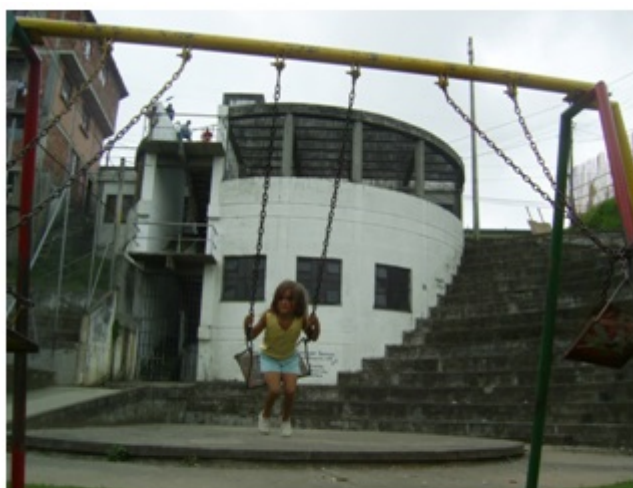
Fotografía 3. Barrio La Avanzada en la calle 27 en la entrada del Camino del Medio, Comuna San José. Fecha: febrero de 2010.