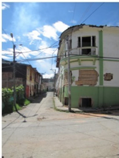
Fotografía 5. En el barrio Colón en la calle 24 carrera 11a, Comuna San José. Fecha: junio de 2010.