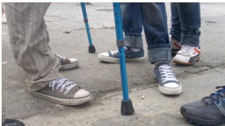
Fotografía 18. Victorino, Parque San José. Año: 2011.

en su cuerpo de una vendetta y heredero de todo ese bagaje oscuro de la pobreza, se constituye como uno de los jóvenes más reconocidos de la Comuna en la actualidad, un reconocimiento trazado no solamente por sus antiguas acciones ilegales, sino por su liderazgo en la búsqueda de salidas al dilema de la pobreza mental y económica de la gente. Esto, a través de la construcción de posibilidades educativas y laborales, para sortear lo que pareciera ser es el rumbo ineludible de la vida de muchos jóvenes de estos sectores marginales de la ciudad, como son la delincuencia, la prostitución, la violencia y la drogadicción.