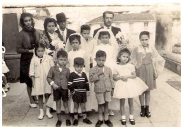
Fotografía 9. En la Iglesia San José, calle 27 carrera 16. Fecha: diciembre 26 de 1962.

Con lo anteriormente citado se puede considerar que la fotografía en la Comuna San José ha cumplido una función indispensable en la composición y la comprensión de la realidad familiar y vecinal en cuanto a la interacción con el pasado y el presente, los cuales son representados de manera artística y casi armónica en la cronología de los álbumes fotográficos, que aunque reposen en lugares recónditos y privados de los hogares de la Comuna, son los que narran un pasado de la vida histórica, social y cultural de los habitantes de este sector de Manizales.