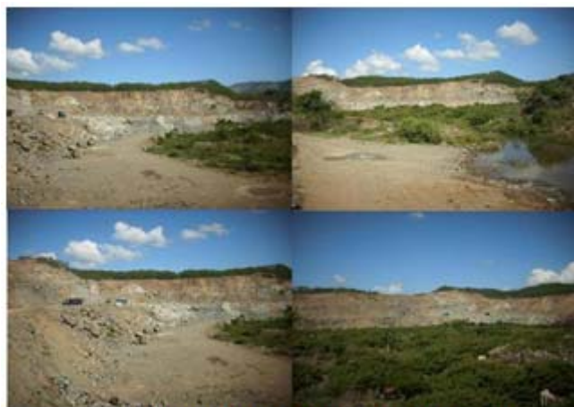
Fotografía 1. Zona en explotación.