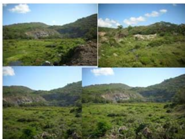
Fotografía 2. Zona de minado antiguo.