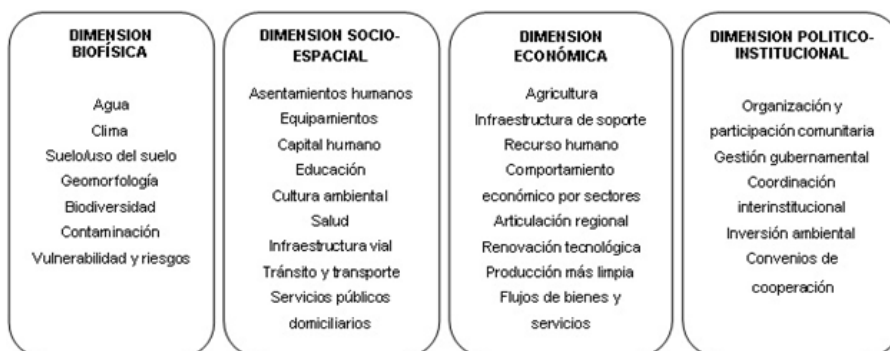
Figura 1. Variables Ambientales asociadas a las Dinámicas Territoriales (VADIT).

De manera seguida, y definido el puntaje línea base, se seleccionaron las Variables Ambientales asociadas a la Sostenibilidad Ambiental Regional (VASAR). A continuación, como producto del análisis de las dinámicas territoriales de una región como referente de investigación (región suroriental del departamento del Valle del Cauca), se identificaron las variables ambientales asociadas a dichas dinámicas, agrupándolas según las distintas dimensiones ambientales (ver figura. 1).