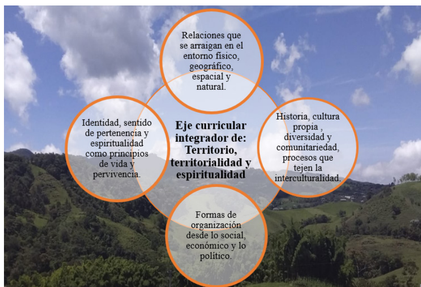
Figura 2. Componentes del eje curricular integrador de territorio, territorialidad y espiritualidad para la I.E Marco Fidel Suárez

Con la finalidad de responder a uno de los propósitos de la Institución Educativa Marco Fidel Suárez: educación con calidad, contenido y contexto, el eje de Territorio, territorialidad y espiritualidad se ha integrado en 4 componentes que articulan las competencias planteadas en el eje desde la educación propia, los lineamientos generales establecidos desde la normatividad vigente (Estándares básicos de competencias, derechos básicos de aprendizaje) y lo planteado desde el modelo pedagógico de la Institución; así: