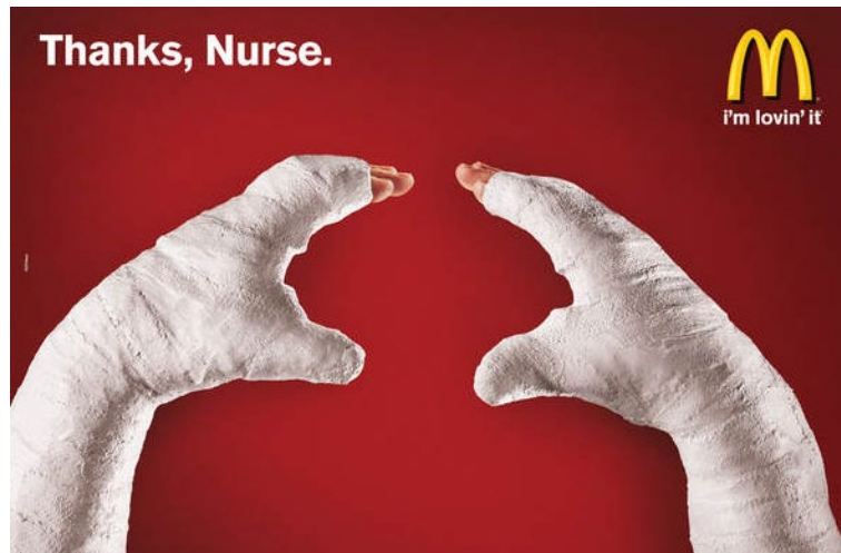
Figura 9. Elipsis.

La última figura que se trabajó en esta sesión fue la elipsis (Figura 9), por medio de un anuncio publicitario de la marca McDonald's en el que se ha suprimido la imagen. La elipsis es una figura de dicción que consiste en la "omisión de una o más palabras que pueden deducirse fácilmente, aunque no estén, ni siquiera próximas, en el texto" (Platas, 2004, p. 243). La elipsis visual "se establece cuando una imagen aparente o expresamente está incompleta. Se produce una omisión 'visual' de algo que tiene que ver con la escena" (Andueza, 2016, p. 74). Esta ausencia posee tanta fuerza que proporciona significado a la representación, ya que invita al receptor a reconstruir mentalmente la imagen (Franquesa y Fontanills, 2013).