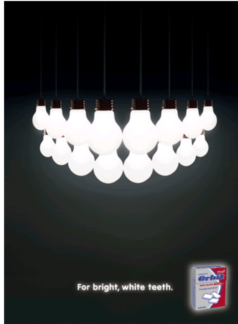
Figura 7. Metonimia.

el anuncio de chicle Orbit (Figura 7), y el de unas vitaminas que ayudan a fortalecer el pelo (Figura 8).