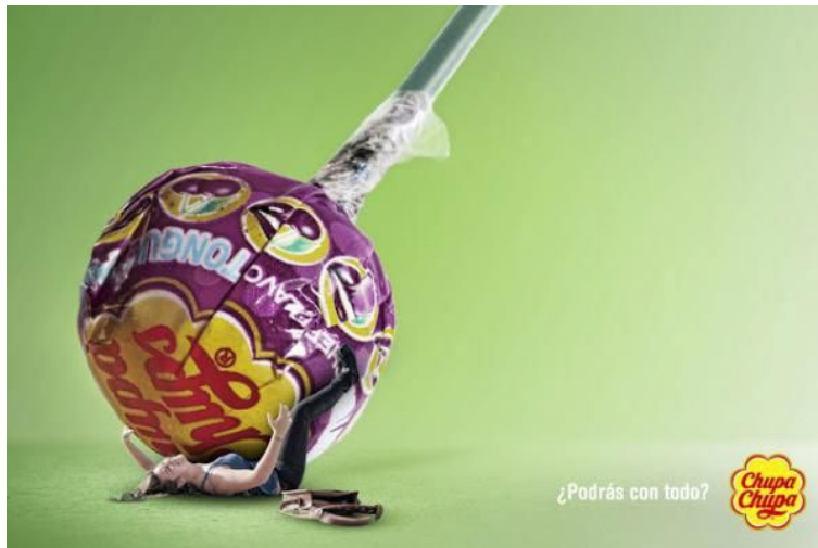
Figura 2. Hipérbole.