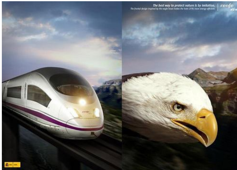
Figura 3. Comparación ave pájaro.