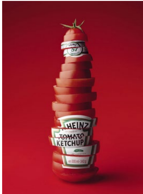
Figura 6. Metáfora.