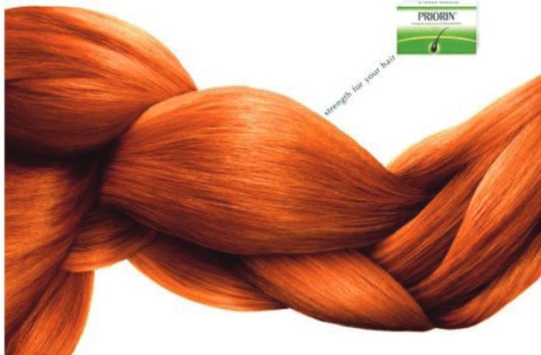
Figura 8. Sinécdoque.