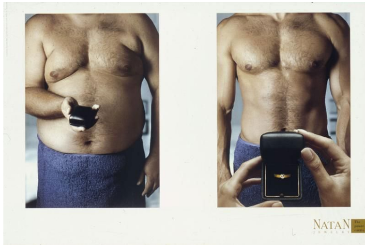
Figura 4. Antítesis.

sí contradicción, por lo que no son generadoras de incoherencia” (Platas, 2004, p. 49). En lo que respecta a la antítesis visual, se contraponen dos imágenes opuestas.