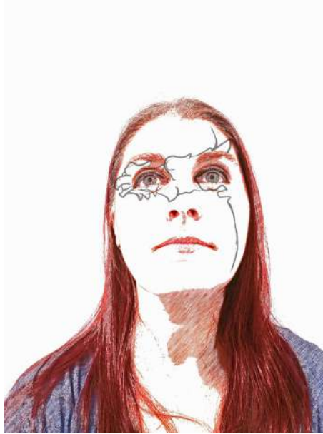
Figura 5. Gárgola e identidad.