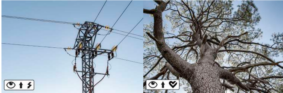
Figura 10. Mirar hacia arriba. Identidad vital, electricidad (izquierda). Mirar hacia arriba. Identidad vital, árbol (derecha).

nuestra identidad vital (Figura 10). Las ramas de los árboles, asociadas a una necesidad biológica que representa con el corazón, y las torres eléctricas, que transmiten la electricidad unida inseparablemente a nuestro día a día.