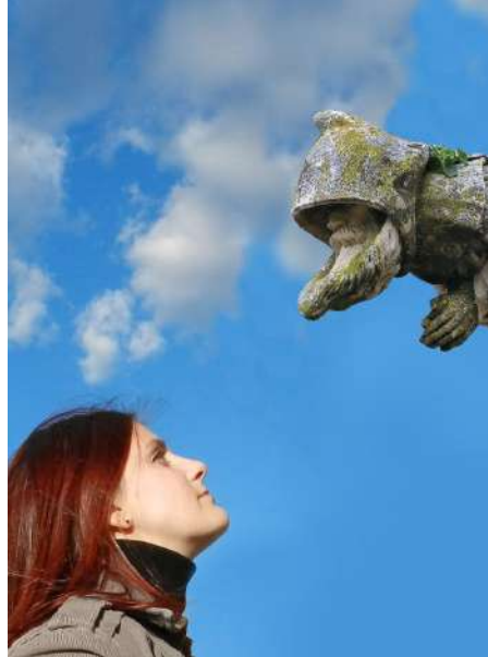
Figura 3. Diálogo directo con la gárgola.