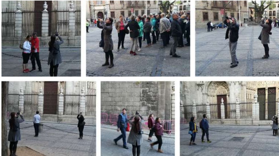
Figura 12. Conclusiones visuales. Contagando mirar hacia arriba. Fuente: Autora (2019).

Podemos concluir que mirar hacia arriba es contagioso, por la curiosidad de la gente por saber qué está pasando ahí donde otro está mirando. Mediante la experiencia de años de retratar la gárgola ha habido muchas situaciones en las que la gente se paraba al lado de la cámara y se ponían a observar aquello que se estaba fotografiando (Figura 12). Es agradable pensar que, esas personas, han abierto los ojos a aprender de las alturas. No podemos demostrar si habrán seguido haciéndolo más allá de ese momento de contagio por atención conjunta, pero sí queda latente la transferencia del interés en este caso concreto con el alumnado de Diseño y Artes Plásticas y Visuales. Esto se ha demostrado con su participación voluntaria en este proyecto, con una implicación que es de agradecer y valorar, y con una profundización en la mirada transmitida a través de imágenes de calidad.