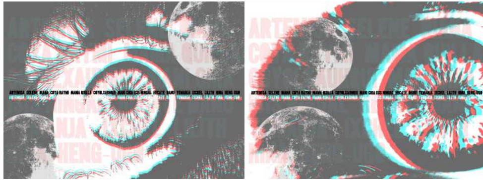
Figura 11. El diálogo cósmico entre la mirada y la Luna.

Cada mirada, cada interpretación y cada identidad han enriquecido de una forma maravillosa los tres pilares que se lanzaban a los alumnos en la propuesta, dotando de un nuevo significado global a la metáfora del mirar hacia arriba. La narrativa construida con el recorrido por estos trabajos de los estudiantes completa y complementa la que hemos visto en método , construyendo con ella un nexo artístico, evocador y emocional, y reafirmando la magia del proceso de enseñanza-aprendizaje cuando todos participamos al mismo nivel: la bidireccionalidad del conocimiento. Usando las palabras de Flusser, “tal relación espacio-tiempo reconstruida a partir de la imagen es propia de la magia, donde todo se repite y donde todo participa de un contexto pleno de significado” (citado en Costa, 2007, p. 26).