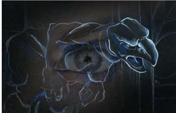
Figura 4. Reciprocidad en la mirada a través de la creación artística.