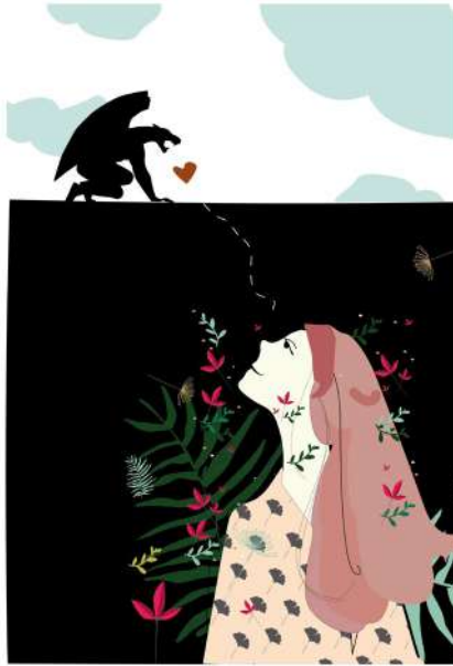
Figura 7. Diálogo de la feminidad con la gárgola (ilustración inspirada en la quimera del Puente del Reino en Valencia).

Continuamos esta nueva narrativa construida a través del recorrido por las participaciones y dejamos a la gárgola, pero no la mirada a las alturas, ya que es uno de los temas que apasionan a Rosa Ana. En sus imágenes (Figura 8) mantiene los pilares de la investigación y los hace suyos. Vemos una atención por los cielos con nubes y las esculturas en lo alto de los edificios. La identidad se refleja en el tratamiento de la imagen, la orientación norte de los cielos y la representación de su mirada en una hipérbole de unas medias lunas que se producen ópticamente en cada uno de sus ojos.