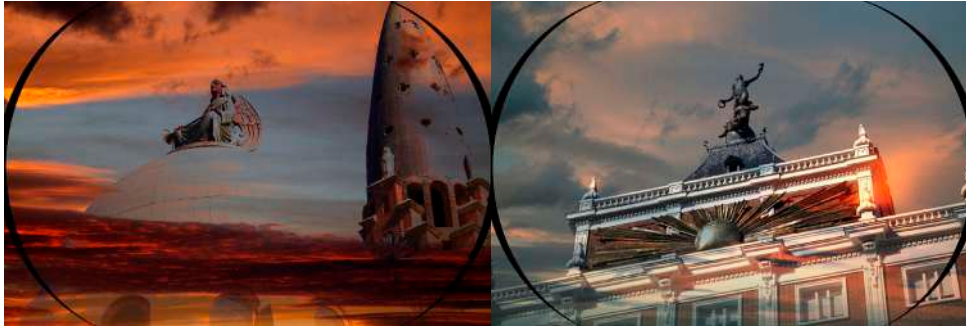
Figura 8. Orientación norte, ángel (izquierda). Orientación norte, ocaso (derecha).

María también mira a las alturas y tiene un diálogo con los monumentos de Huelva (Figura 9) tratando de recuperar la historia de la ciudad narrada en estas representaciones. Ella las describe como “recuerdo vivo de la grandeza histórica que un día aconteció en este lugar” del que partiera Cristóbal Colón en su primer viaje. De entre ellos, destacamos su diálogo con el Monumento a la Fe Descubridora.