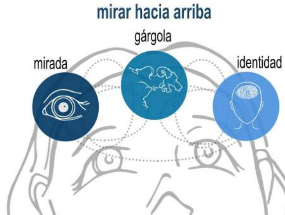
Figura 2. Los tres pilares del origen de la experiencia: mirada, gárgola e identidad.

Los tres pilares que mueven la investigación identitaria inicial —ejemplo que se presentó a los estudiantes— son la mirada, la gárgola y la identidad (Figura 2). Para ser coherente la relación de estos tres pilares se presentó en forma de narrativa visual. La intención es compartir y contagiar el interés por mirar hacia arriba, despertando la atención por lo oculto, lo olvidado, lo escondido. Presentamos como olvidado la gárgola, pero se anima a los alumnos a sustituirla por aquello con lo que se identifiquen más.