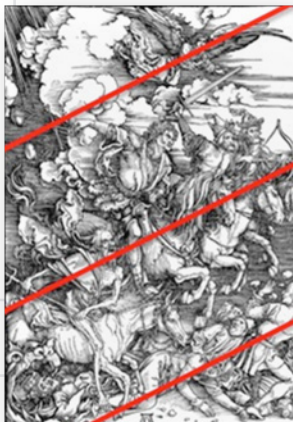
Ilustración 10. Estructura compositiva.