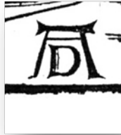
Ilustración 2. Monograma.

No obstante tratarse de un grabado vinculado a un fin, la presencia del autor como individuo que emite una opinión desde la interpretación iconográfica, aparece como rasgo que delata su presencia como figura creativa en la obra y que lo distancia con el Gótico, pues el artista ya se evidencia como creador de ideas expresadas en el cuadro y no como instrumento de las imágenes preconcebidas “inspiradas” 4 por Dios. La firma del autor visible en su monograma (Ilustración 2), que se cree apareció por primera vez en esta obra, se convierte en una suerte de elemento escópico (cfr. Mitchell, 2009: 20) con identidad y discurso que asimila las condiciones y espíritu del artista. Su firma se reconoce en la historia del arte como un texto que contiene la episteme que lo representa: su influencia en el Renacimiento alemán, su virtuosismo técnico, la intelectualidad artística.