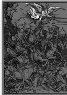
Ilustración 4. Apolión.

La asociación filológica del ángel lleva a una relación con el dios griego Apolo que, en palabras de Panofsky (1995: 271), elimina el mal con su arco o con su égida, dios al que también se atribuye el poder de traer las plagas o eliminarlas. En segundo plano aparecen los jinetes del Apocalipsis, y en tercer plano un grupo conformado por un obispo devorado por un dragón, con burgueses y campesinos como representación de la humanidad.