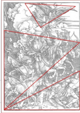
Ilustración 12. Estructura piramidal.

El valor de la obra estriba en la efectividad del discurso que logra trascender los tiempos y asimilarse en la actualidad. La obra testifica además de la relación entre el texto y la imagen tensiones entre épocas, pues recoge elementos provenientes de la Edad Media mientras se le adicionan otros plenamente renacentistas, como demuestra Panofsky (1995: 293) sobre Durero: “Incluso en su plena madurez, no llegó nunca a ser un puro artista del Renacimiento”. El momento en el que surge el libro Apocalipsis es clave para identificar los cismas sociales que se avecinaban en Alemania con la posterior Reforma, la cual se convertiría en motor de impulso a modificaciones fundamentales a la visualidad europea. Se trata justo del momento histórico que separa con consciencia los preceptos medievales y en los cuales el mismo Durero tuvo incidencia con sus ensayos sobre la perspectiva: