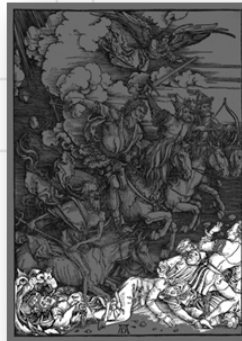
Ilustración 9. La Humanidad.