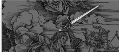
Ilustración 6. La Guerra.

Cuando abrió el segundo sello, oí al segundo ser viviente, que decía: Ven y mira. Y salió otro caballo, bermejo; y al que lo montaba le fue dado poder de quitar de la tierra la paz, y que se matasen unos a otros; y se le dio una gran espada. (Juan, 6:3-4).