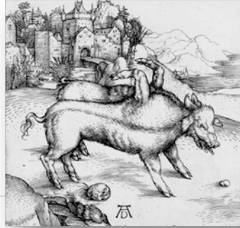
Ilustración 3. La cerda monstruosa de Landser, Alberto Dürero (1496).

Bajo tales circunstancias, el discurso inscrito en el grabado de Dürero provee elementos dialógicos comunes a diferentes épocas y culturas cercanas a La Biblia, además de provenir del lenguaje escrito trasladado con fidelidad a la imagen, se constituye en un paradigma visual-textual representativo no de una época, sino del pensamiento humano. No obstante la fuente literaria de la que bebe, el sistema de signos visuales de Los cuatro jinetes del Apocalipsis se interpreta con transparencia en su intención iconológica, el discurso visual se emite con inmediatez y con la complejidad propia de lo transmitido en los elementos significantes.