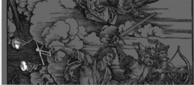
Ilustración 7. El Hambre.

En la interpretación moderna, La Balanza se asocia con el equilibrio de las fuerzas económicas, sin embargo, y atendiendo al carácter pagano que influenciaba desde tiempos romanos la iconografía católica, debe revisarse la descripción asumida por Ripa (2007: 347-348) sobre el Equinoccio de Otoño, entre los elementos iconográficos que describe la figura, se encuentra una balanza: “La Libra o Balanza que también sostiene es uno de los doce signos del Zodíaco, entrándose por él el Sol en el mes de septiembre al tiempo del Equinoccio, que es cuando se iguala al día con la noche”. Varias lecturas surgen desde la descripción iconológica de Ripa, y una de ellas es la que permite simbolizar El Hambre con su reflejo invertido mediante una aproximación a la estación del Otoño que es cuando las frutas se encuentran maduras. Al igual que los otros caballeros, su furia arremete contra los humanos y se asume que contra sus actos y construcciones: los cultivos, las comodidades, los hombres, las pasiones, las instituciones, los reinos humanos.