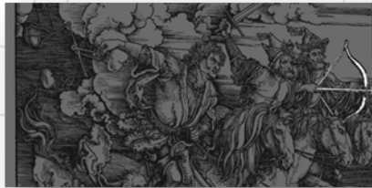
Ilustración 5. La Conquista.

Vi cuando el Cordero abrió uno de los sellos, y oí a uno de los cuatro seres vivientes decir como con voz de trueno: Ven y mira. Y miré, y he aquí un caballo blanco; y el que lo montaba tenía un arco; y le fue dada una corona, y salió venciendo, y para vencer. (Juan. 6:1-2).