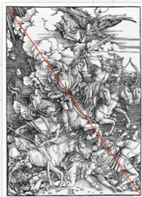
Ilustración 11. Conexión Dios-humanos.