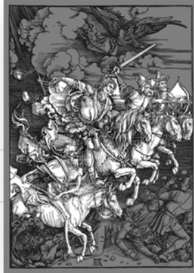
Ilustración 8. Grupo de Jinetes.

y públicas, más aún, si las imágenes se constituían en recurso para la enseñanza de aspectos paradigmáticos sociales.