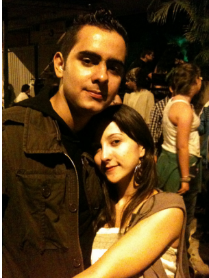
4. Novios. Autor: M3-UPB