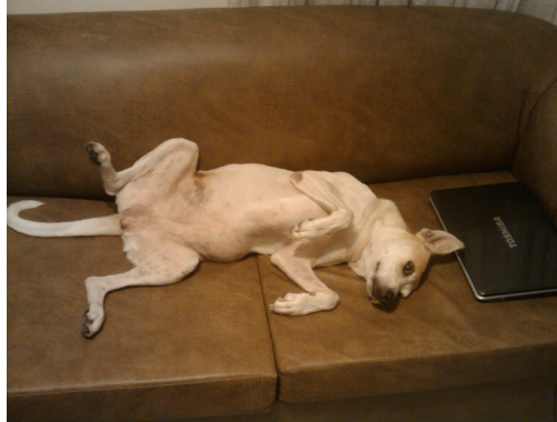
6. Perro en sofá.

Las imágenes y comentarios que hacen parte de la categoría “Referentes de Memoria Urbana” hablan simbólicamente de espacios físicos emblemáticos de la ciudad del siglo XX, abarcando varias temáticas: históricas, culturales y sociales. Es necesario resaltar que del ámbito social sólo 8 fotos corresponden a esta categoría, o sea el 4,5% del total; para comprender que el centro de la ciudad con sus edificaciones y espacios más representativos sigue siendo una de las zonas predilectas por su tradición y memoria histórica.