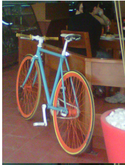
2. Bicicleta. Autor: H6-UdeA