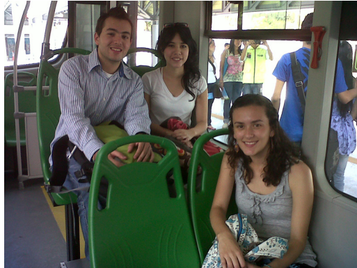
10. En Metroplús. Autor: M2-UPB