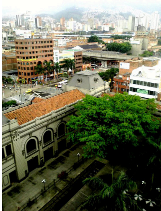
7. Estación del Ferrocarril de Antioquia. Autor: M5-UPB