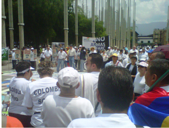
13. Protesta contra las FARC. Autor: H6-UdeA