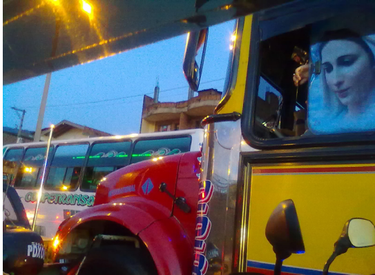
1. Bus y virgen. Autor: M6-UPB