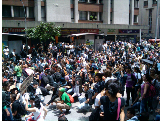
15. Manifestación estudiantil. Autor: H2-UdeA.

En cuanto a las fotografías entregadas por los participantes de ambos grupos focales, se les realiza un análisis iconográfico para determinar cuáles son los principales actores de sus imágenes y los planos fotográficos más utilizados. Las siguientes tablas (1-2) ilustran dichos contenidos: