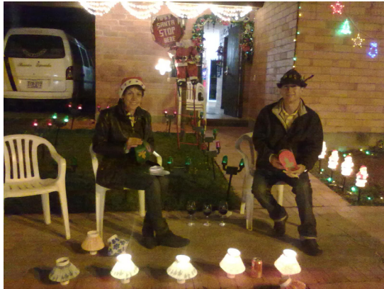
5. Navidad en familia.