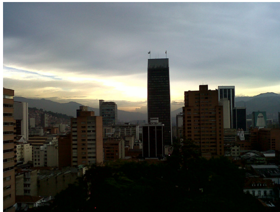
8. Edificio Coltejer y alrededores. Autor: M5-UPB