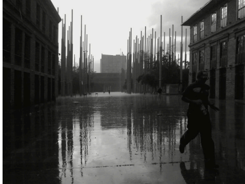
12. Plaza de la Luz B&N. Autor: M1-UPB

Los comentarios e imágenes de la categoría “Organización y Funcionalidad” muestran las distintas manifestaciones de los estudiantes para expresar públicamente a través de las redes sociales su postura u opinión, ya sean éstas de orden social, económico o político. En dicho ítem se observan 6 fotografías, que equivalen al 3,3 % del total del material documental; éstas revelan protestas de distintos grupos de trabajadores y la entrada del Escuadrón Móvil Antidisturbios –ESMAD- a la Universidad de Antioquia.