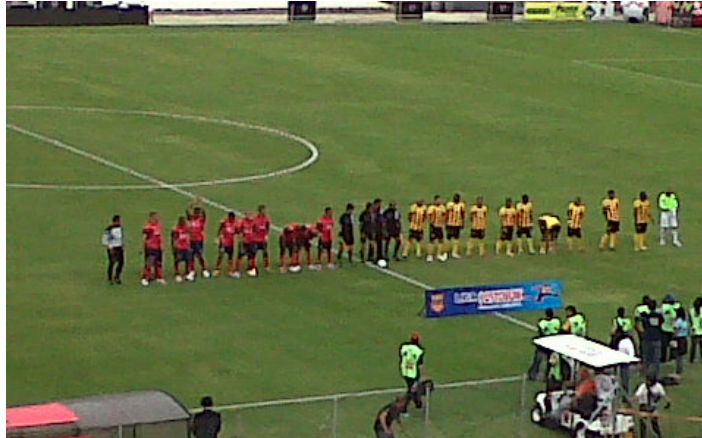
3. Partido de fútbol. Autor: M2-UPB

La siguiente categoría en orden de importancia fue: “Vivencias Cotidianas”, que reúne retratos y comentarios alusivos a las percepciones, gustos, experiencias, o interacciones en espacios sociales familiares o individuales, vinculadas a la cotidianidad de quien tomó la fotografía. Son un total de 62 imágenes que corresponden sobre el total, al 35% de la muestra. Las interacciones con los amigos, los familiares, las mascotas, en lugares de encuentro como casas familiares, bares y centros comerciales, son los actores y espacios en donde se crean las imágenes de identidad individual; es allí donde se dan los procesos vivenciales y reflexivos del habitar. En ese sentido, los smartphones reafirman su función como una tecnología relacional a través de la cual pueden gestionar la identidad, ejerciendo un poder cultural en el sentido de compartir y poner en circulación en las redes sociales todas aquellas representaciones visuales de la vida cotidiana, promoviendo procesos simbólicos para designar en sus propios términos y desde un lugar particular de enunciación al mundo; en este caso a Medellín.