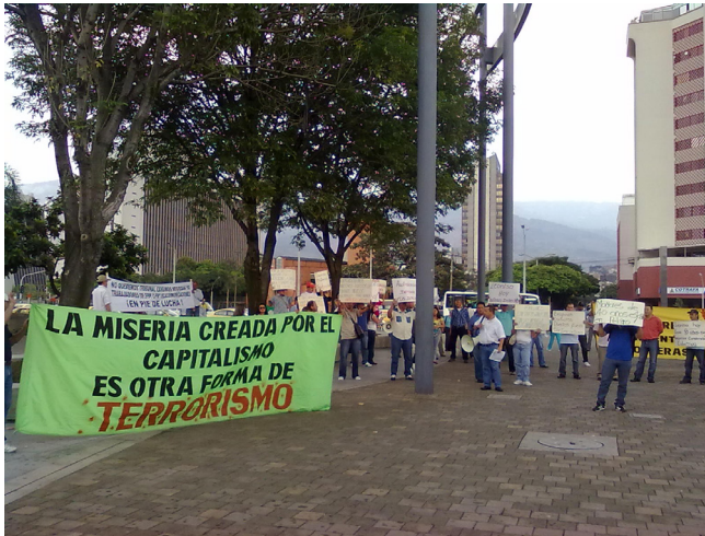
14. Huelga Leonisa. Autor: M6-UPB