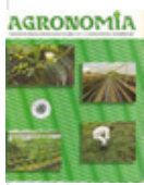
Agronomía Ciencias Agropecuarias