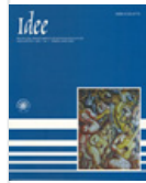
Idee Estudios Educativos