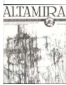
Alta Mira Artes