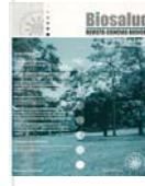
Biosalud Ciencias Básicas