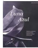
Luna Azul Medio ambiente, comunidad