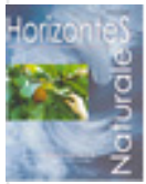
Agronomía Ciencias Agropecuarias