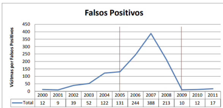
Figura 1. Falsos positivos en Colombia

Cárdenas Mateus (2013) demuestra econométricamente la incidencia de estos incentivos en el aumento de ejecuciones arbitrarias, especialmente durante el gobierno de Álvaro Uribe Vélez, como se muestra en la Figura 1.