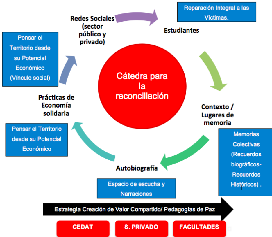
Ilustración 1. Propuesta para la reconciliación articulada a los ejes de la Universidad de Caldas- (Chamorro, 2016) 6