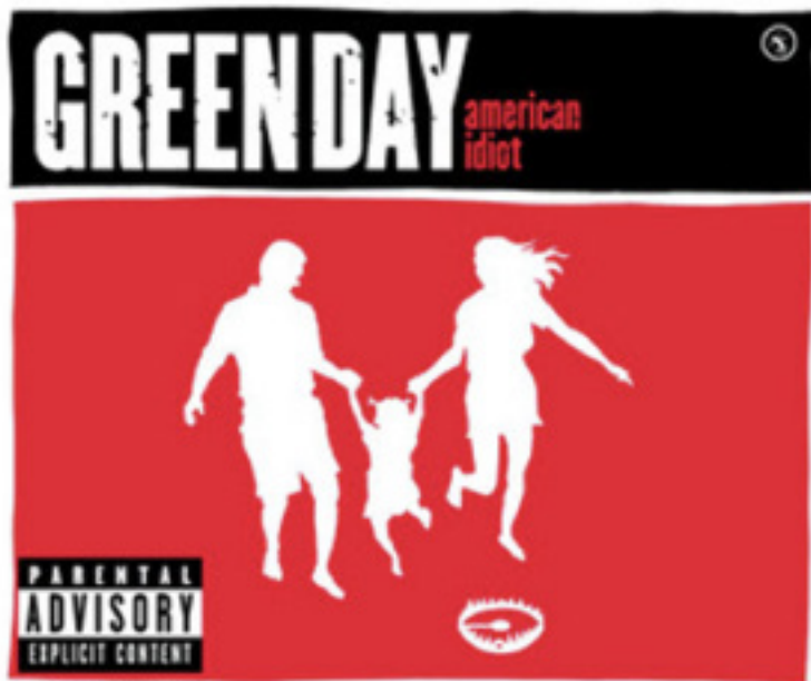
Figura 1. Cover art para “American Idiot”, Green Day (2005).

Punk Rock 6 — lo que se quiere poner de relieve tiene que ver con la posibilidad de admitir en los esfuerzos de comprensión de las realidades familiares la dimensión poética, la cual se expresa de múltiples formas, y se materializa —y resuena— en la obra de arte (Figura 1). “El arte ya no es más que una palabra a la que no corresponde nada real” (Heidegger, 2010, p. 35). En opinión del filósofo, el arte tiene una concreción material que es, a la vez, portadora de un símbolo. El arte “encierra algo más”; dice algo a quien está en disposición de dejarse decir “algo” por él.