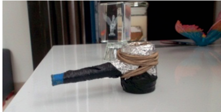
Figura 1. Pipa o llamado por los consumidores 'carro'.

Se han comparado los datos comunicados por algunos sujetos de la investigación frente al carácter, su madurez y su inmadurez; aunque es importante analizar que tiene más desventajas y una cotidianidad más difícil, aquel que como consumidor de bazuco es débil de carácter y no puede controlar el impulso de consumir compulsivamente.