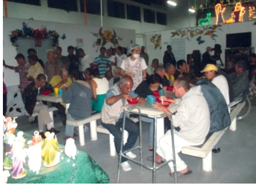
Figura 3. Diciembre de 2014, habitantes de La Casa.

Bruto refiere un elemento importante que habla del carácter social e individual, y es la angustia que los sujetos consumidores compulsivos de bazuco tienen tanto despiertos como dormidos, el cual es importante nombrar.