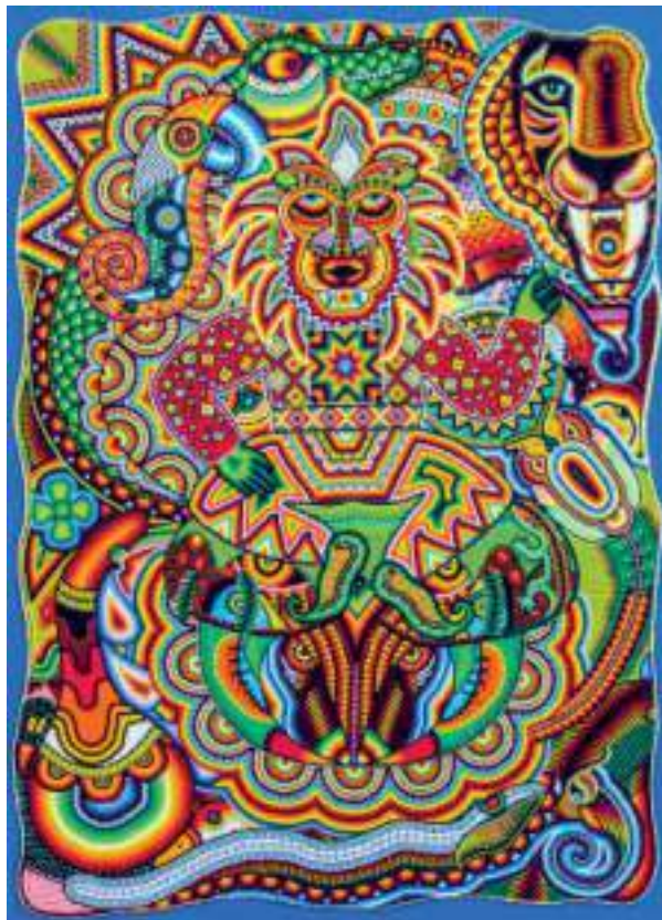
Figura 7. “Duende-selva”, de Germán Eliecer Lasso.

Las máscaras del Sibundoy tienen una función importante en la expresión del grupo indígena Kamsá, en ellas se aprecian contenidos profundos que narran elementos importantes de su cultura. A menudo en ellas se pueden ver chamanes con todo su tocado de plumas, collares y atuendos característicos de la toma del yagé, acompañados siempre de gestos expresionistas donde se demuestra la fuerza que poseen para guiar el ritual. Todo su arte hace parte de una amplia concepción visual relacionada con la interpretación de fenómenos naturales que se relacionan con creencias culturales propias, constituyéndose y transformándose a partir de experiencias con su entorno —en este caso, la selva— con todas las connotaciones mágicas y ritualísticas que posee.