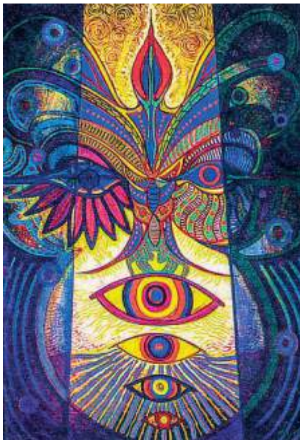
Figura 8. “Flor de Sol”, de Javier Lasso.

La siguiente obra hace parte del trabajo del artista Javier Lasso, docente de la Universidad de Nariño. En ella se puede apreciar una simbología relacionada con las experiencias en el ritual del yagé. La obra de Lasso responde a su trabajo con las culturas indígenas a partir de su aprendizaje como sanador y hombre de conocimiento.