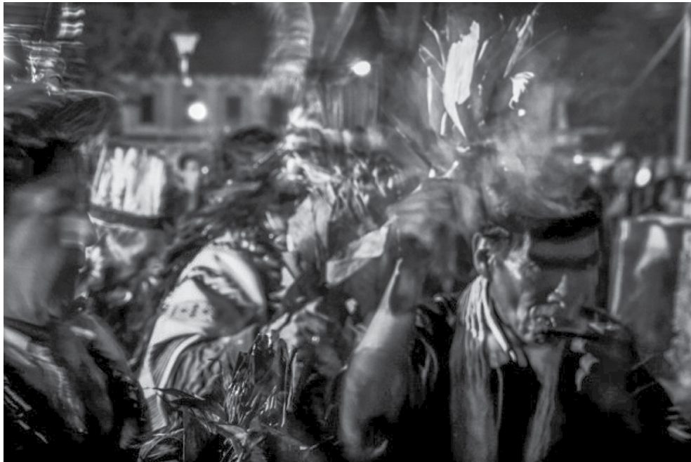
Figura 13. Fotografía de Nicolò Filippo Rosso.

La siguiente obra es del artista y fotógrafo italiano Nicolò Filippo Rosso. Este hace un recorrido por el ritual del yagé participando activamente como aprendiz, su obra busca dar a conocer su experiencia dentro de la comunidad Kamsá.