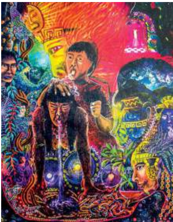
Figura 2. Pintura de Pablo Amaringo.

Luis Eduardo Luna (1996) dice, además, que en la obra de Amaringo podemos ver “seres extraterrestres de planos y sistemas solares distantes” (p. 76). Estos seres a los que se refiere Luna pueden ser visionados por los chamanes que han logrado alcanzar planos más avanzados debido a su disciplina e impecabilidad en su mundo cotidiano.