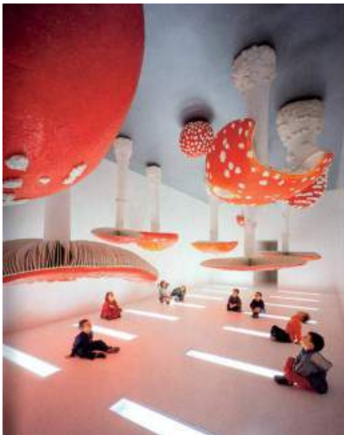
Figura 18. “Rotating Mushrooms”, de Carsten Höller.