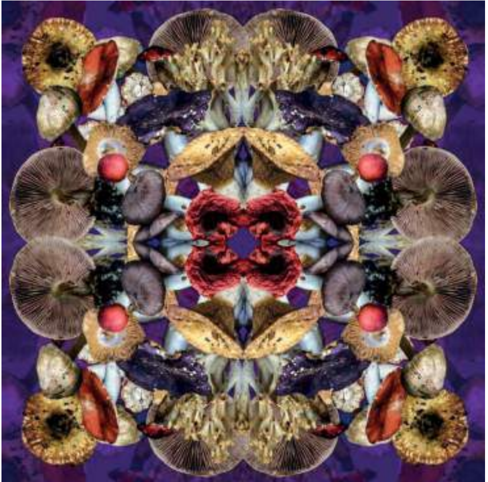
Figura 14. 'Hongosto', de Karen Lau.

La obra 'Hongosto' es un collage fotográfico de la artista mexicana Karen Lau. La composición está realizada a partir de imágenes de plantas enteógenas, específicamente con los hongos del género psilocybe que transforma en una especie de simetría relacionada con el tiempo.