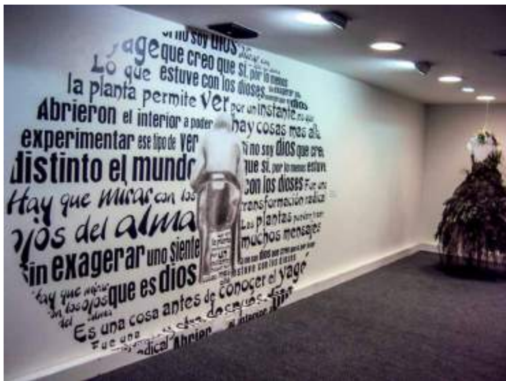
Figura 19. “Reflejos psíquicos y visionarios”, del semillero de investigación experimental “Plantas y Arte”.

El semillero de investigación experimental “Plantas y Arte”, de la Universidad de Caldas, investiga la relación de las plantas enteógenas con el arte. Es el caso de la propuesta artística llamada “Reflejos psíquicos y visionarios”. Se trata de una búsqueda de relatos sobre las experiencias con las plantas a través de recorridos por diferentes lugares en los que habitan personas que han tenido una transformación personal al tener contacto con las sustancias enteógenas. La obra se alimenta de frases, sentimientos y dibujos que estructuran la composición.