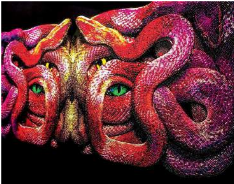
Figura 11. “Sacerdote Chavín”, de Harry Chávez.

La obra del artista peruano Harry Chávez, explora materiales utilizados por diferentes comunidades ancestrales hoy en día. Se trata de las cuentas o chaquiras pegadas sobre una superficie plana. La composición detallada y minuciosa es una muestra del dominio de la técnica en un alto nivel. Las imágenes están relacionadas con los símbolos que surgen en los rituales ancestrales, especialmente con la wachuma o San Pedro ( Trichocereus Pacha noi ). Este es el caso de la obra “Sacerdote Chavín”, en la que podemos apreciar serpientes enlazadas que guardan un ser de ‘poder’.