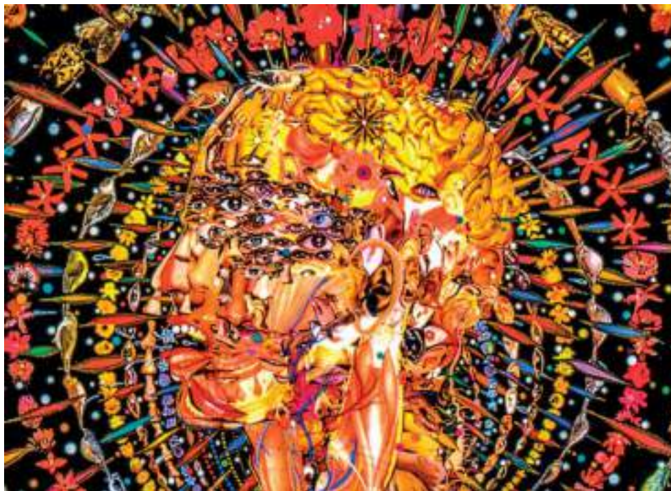
Figura 10. 'Born', de Fred Tomaselli.

La obra 'Born' del artista estadounidense Fred Tomaselli incluye extractos de plantas enteógenas, fotografías y dibujos con imágenes de pájaros, flores y partes humanas con el propósito de seducir a los observadores a entrar en sus imágenes y propiciar una experiencia estética trascendental. El artista describe sus obras como una ventana abierta hacia un universo visionario, cargado de imágenes.