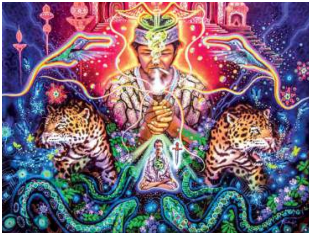
Figura 4. Pintura de Juan Carlos Taminchi.

Juan Carlos Taminchi es un joven pintor peruano que sigue la senda del arte visionario, sus obras son realizadas con una gran técnica donde demuestra su formidable virtuosismo. Según el artista, sus maestros han sido la academia y las plantas sagradas. En sus pinturas podemos ver de forma repetitiva animales de 'protección' y conocimiento tales como el jaguar, la serpiente y el tigre.