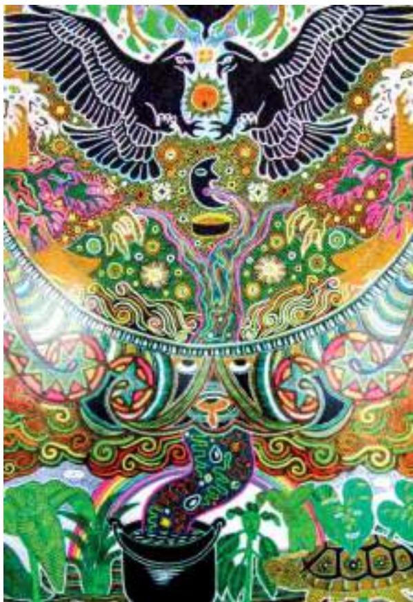
Figura 6. Obra de Domingo Cuatindioy.

Una de las técnicas más utilizadas por los artistas del Putumayo es el trabajo con chaquiras o cuentas de colores incrustadas o pegadas sobre madera y lienzo. Una técnica sumamente dispendiosa con resultados realmente sobresalientes. Este es el caso de “Duende-selva”, obra de Germán Eliecer Lasso en la que podemos observar una gran carga de imágenes visionarias y simbólicas. En la técnica hay una relación importante con el puntillismo, método muy utilizado dada la analogía con la visión que se tiene en una experiencia con enteógenos.