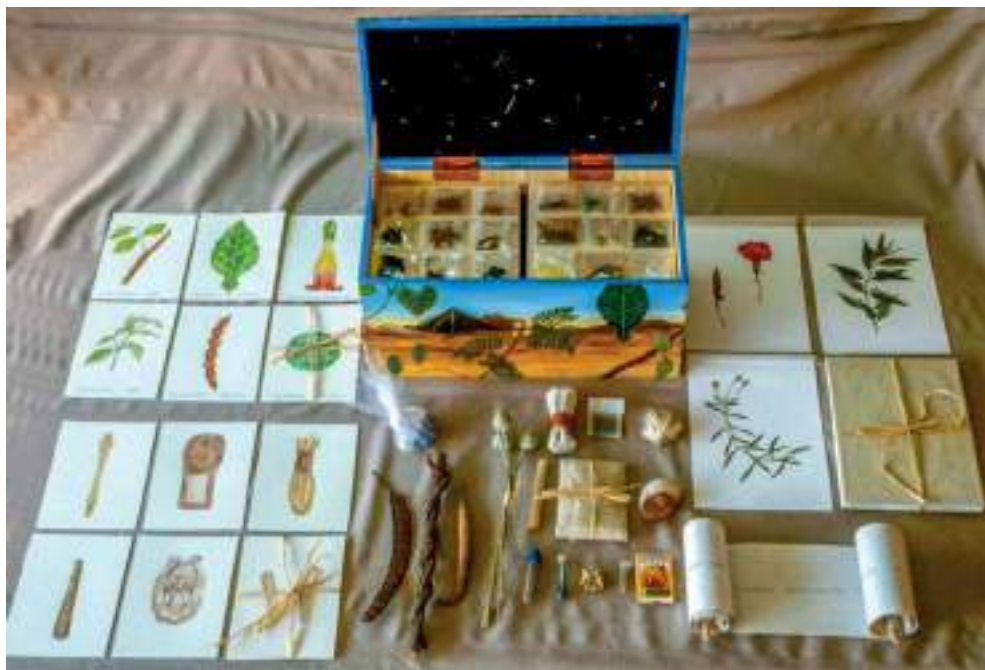
Figura 15. “Maletín psiconáutico”, de Donna Torres.

Dentro de esta expresión artística encontramos la obra de Donna Torres —artista colombo-canadiense— quien explora la relación entre arte, chamanismo y enteógenos. Su obra “Maletín psiconáutico” está basada en sus viajes alrededor del mundo en busca de las plantas maestras; así, a través de sus recorridos, la artista recoge muestras de plantas y dibuja y recolecta objetos relacionados con los rituales ancestrales.