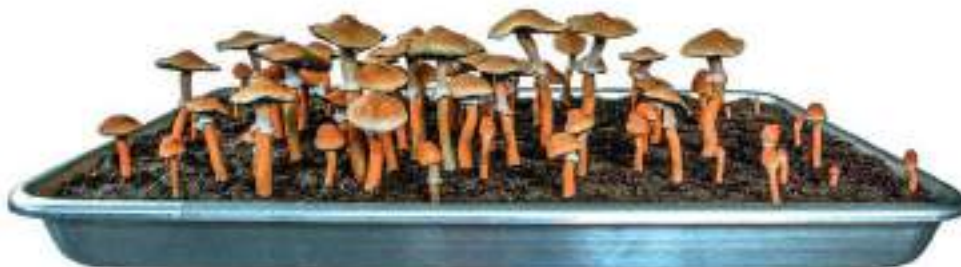
Figura 17. “ Psilocybe Cubensis Tray”, de Roxy Paine.

El artista estadounidense Roxy Paine basa su obra en evidenciar la transformación de la naturaleza a través de procesos orgánicos naturales. Su obra “ Psilocybe cubensis tray” es una réplica escultórica del hongo sagrado. La intención del artista para realizar esta obra se basa en el reconocimiento de las plantas visionarias a partir de una acción artística. Busca, además, evidenciar la tensión entre los entornos artificiales y orgánicos; de una manera realista y fiel a la naturaleza. En sus esculturas podemos ver plantas como la datura, hongos psilocybe , amanita muscaria y las amapolas.