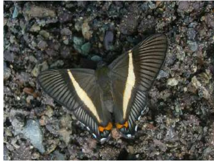
Siseme pallas.