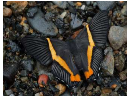
S. pallas xanthogramma.