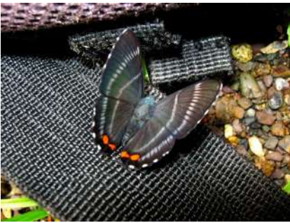
Siseme aristoteles sprucei (Foto J. Salazar).