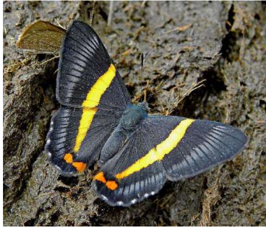
Siseme aristoteles antioquiensis (Foto J. Restrepo).