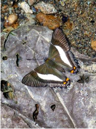
Siseme pallas angustior (Foto C. Ríos-M).