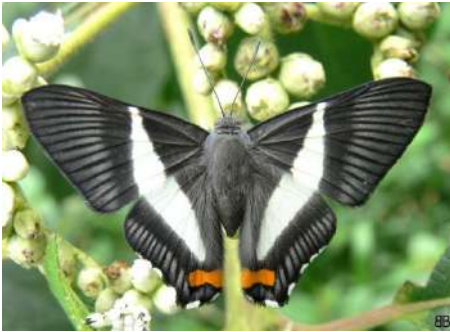
Siseme neurodes.