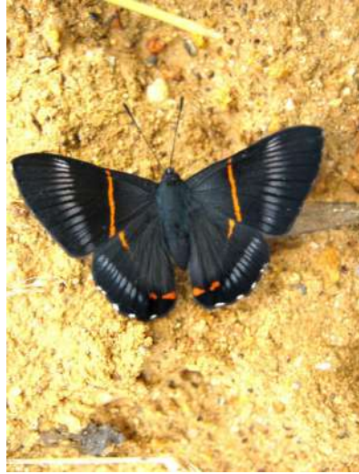
Siseme aristoteles minerva (Foto J. Salazar).