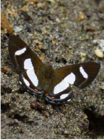
Siseme alectryo