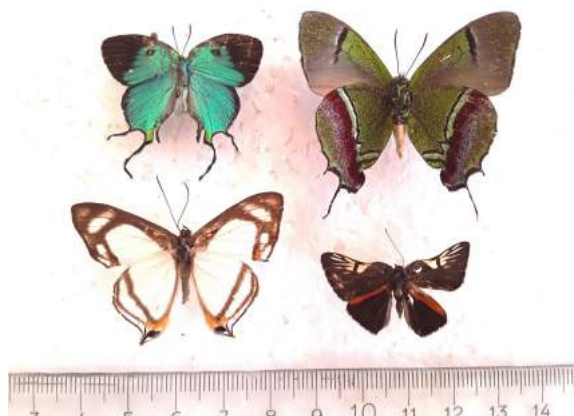
Leyendas: de izquierda a derecha arriba, Lycaenidae: Arcas imperialis (Cr.), Evenus regalis (Cr.), abajo, Riodinidae: Uraneis lycorias (Hew.), Symmachia accusatrix (Ww).