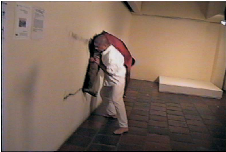
Figura 6. Mugre (Sandoval, 1999).

cadáver de un preso político sobre la Plaza de Bolívar de Bogotá para que la plaza y el asfalto se lo fueran comiendo a medida que yo lo iba arrastrando. Por razones de seguridad no la he podido hacer y se quedó en mi libro de proyectos. (Sandoval, 1999, p.1).