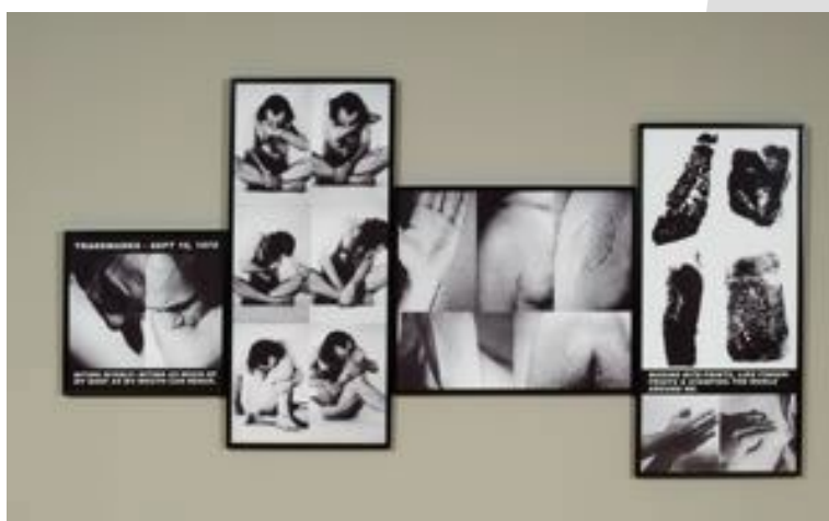
Figura 7. Trademarks (Acconci, 1970)

Un buen ejemplo es la obra de Vito Acconci, Trademarks (1970), donde él se sienta delante de una cámara de video para morderse partes de su cuerpo y percibir las marcas en su piel, pasando a entintarlas e imprimirlas sobre papel. “Mordiéndome, mordiéndome todas las partes del cuerpo a las que llego. Aplicando tinta de imprenta a los mordiscos: estampando huellas de mordiscos en distintas superficies”. Y el artista continúa revelando su intención en la obra: “es un intento de reclamar el cuerpo como propio mediante gestos autorreflexivos que luego dejaban impresos los signos de su identidad” (Acconci citado por Bernal, 2014, p. 58)