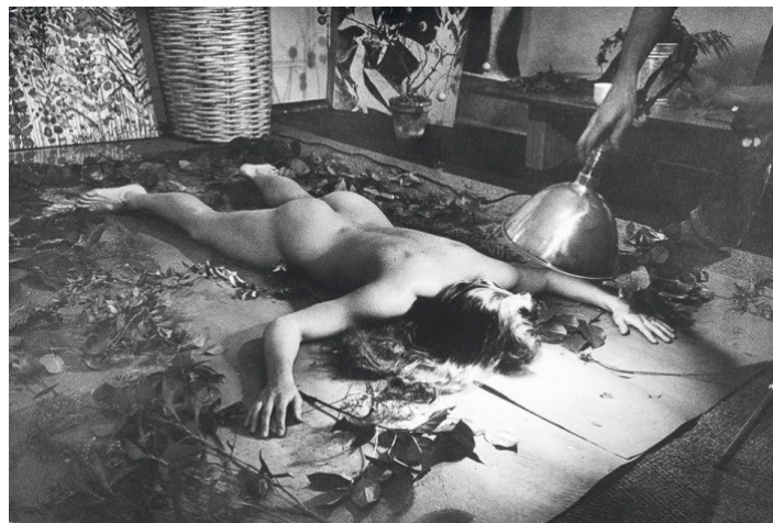
Figura 2. Blueprints (Rauschenberg, 1949)

real y espacio real, trabajo colaborativo, un “compromiso” con el espectador, la inclusión, la espontaneidad, la oscilación entre “opuestos”: dentro/fuera, el arte/vida, conocido/desconocido.