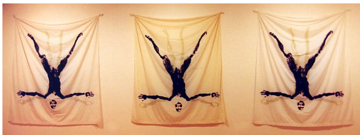
Figura 5. Ropa usada (Salerno, 1995)

propio artista, y la contemporánea: La pileta . Sin embargo, es de mayor interés comprender esta obra como un proceso de puesta material del mismo concepto, con variantes formales sujetas tanto al tiempo como al espacio de exhibición.