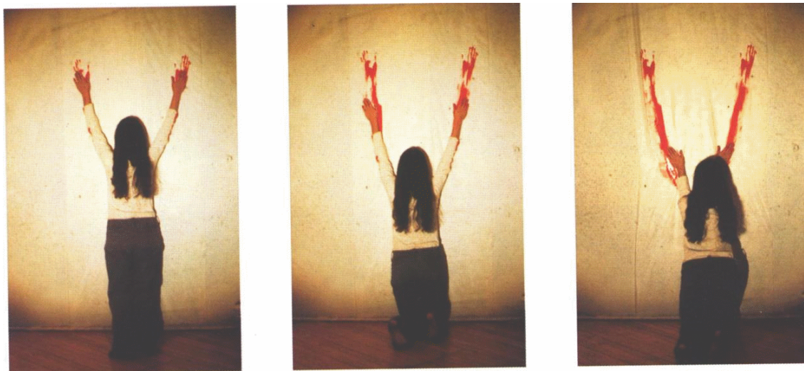
Figura 3. Body Tracks (Mendieta, 1974)

El trabajo de Ana se afiliaba al earth art, pero un rasgo la distinguía de la ejecución habitual de esa tendencia. Por lo común, en el earth art se proclama la materia natural desplazándola de su contexto de origen para jerarquizarla en otro diverso o introduciendo cambios sugerentes en el propio medio natural, casi siempre en gran escala. Es la tierra puesta en función de la voluntad del ser humano. En Ana hay una actitud más modesta: es el ser humano quien va hacia la tierra, quien se integra al medio natural. No para violentarlo, sino en procura de una fusión íntima. No busca transformar sino participar.