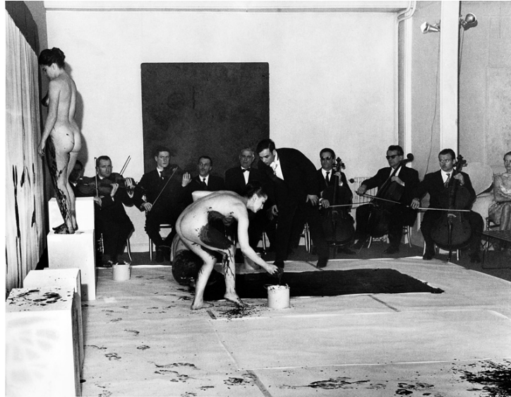
Figura 1. Sinfonía Monótona (Klein, 1947)

El arte de Rauschenberg, a pesar de que no exige la presencia de actores o ejecutantes, es un arte de la acción y de la alegoría debido a la centralización de las siguientes características: en tiempo