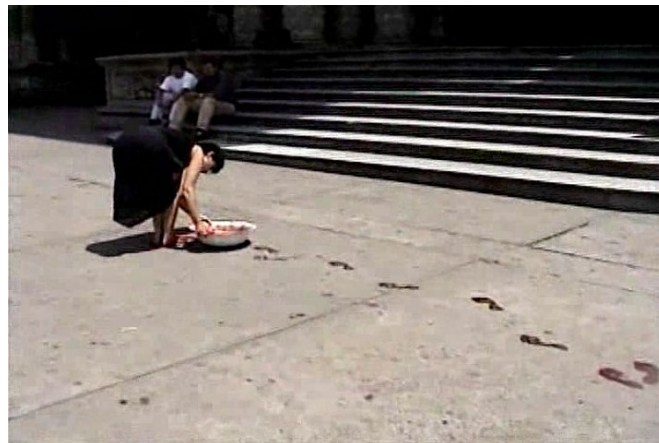
Figura 4. ¿Quién puede borrar las huellas? (Galindo, 2003)

Regina Galindo es más atrevida y realiza una acción con sangre humana, centrado su interés en el contexto de su país natal: Guatemala. En ¿Quién puede borrar las huellas? (2003) la artista sumerge repetidamente sus pies en un recipiente lleno con sangre humana mientras camina desde la Corte Constitucional al Palacio Nacional, dejando un rastro de huellas.