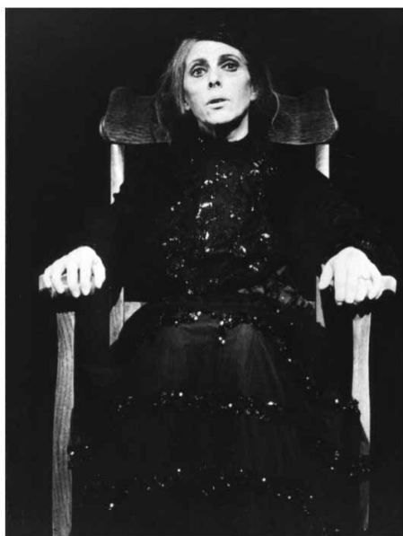
Figura 2. Actriz: Billie Whitelaw. Rockaby by Samuel Beckett. 1982.

Viéndose así una interpretación controlada, moderada y humilde de esta actriz, cabe decir que el papel de la mujer en la obra de Beckett va más allá de una simple figura que representa un grito de auxilio contra la opresión del género femenino. Beckett propone una enajenación del rol de la mujer frente a varios estados que se encasillan dentro de los marcos familiares, sociales, políticos y culturales, además de presentar una silueta desdibujada por la oscuridad y el vacío. Por ejemplo, el caso de su segunda gran actriz, Billie Whitelaw (Figura 2), a quien presenta como una mujer agresiva, violenta, a través de unos labios hablantes que enuncian palabras coléricas y cargadas de provocaciones en su obra No Yo .